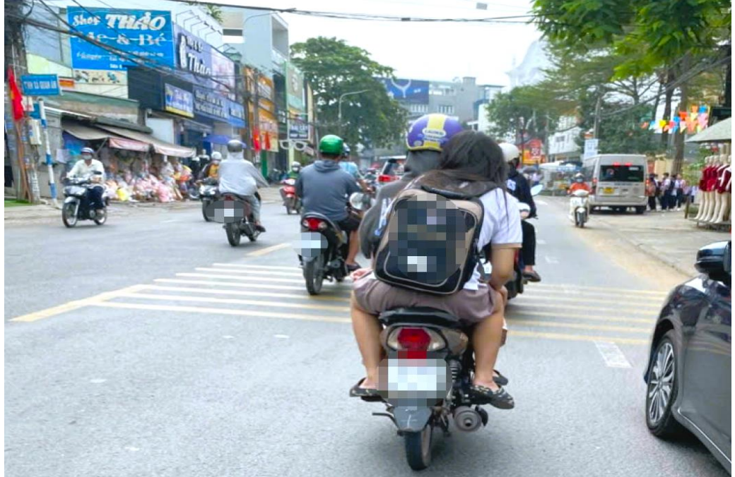
Cảnh báo tình trạng học sinh vi phạm TTATGT sau kỳ nghỉ Tết

Trong tuần, lực lượng Cảnh sát giao thông toàn tỉnh đã lập biên bản xử lý 6 trường hợp học sinh vi phạm Luật giao thông đường bộ, với số tiền nộp phạt hơn 38 triệu đồng , tạm giữ 5 phương tiện.